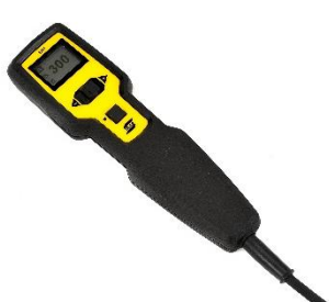
ER 1, commande à distance multifonction avec écran intégré