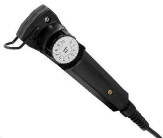
MMA 3, commande à distance traditionnelle destinée au réglage de l'intensité