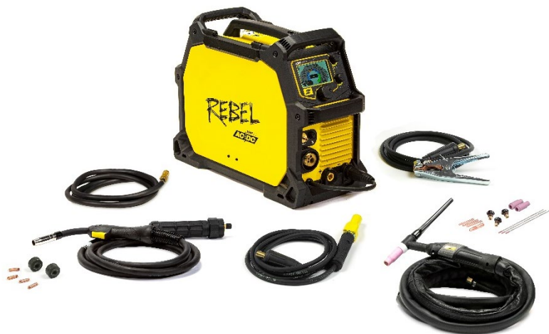
Rebel EMP 205ic AC/DC et ses accessoires.

Nous avons rendu l'impossible possible en fabriquant le premier poste à souder compacte et multi-procédés, qui rassemble les procédés MIG, fil fourré, MMA, TIG DC et désormais TIG AC. Oui, vous avez bien lu : Vous êtes capable de souder l'aluminium grâce au procédé TIG AC avec le Rebel EMP205 AC/DC. Il offre les meilleures performances pour chaque procédé de sa catégorie sur le marché. C'est une machine industriel, compacte avec des poignées arceaux, une structure robuste en acier ce qui vous permet de souder tout et... partout.